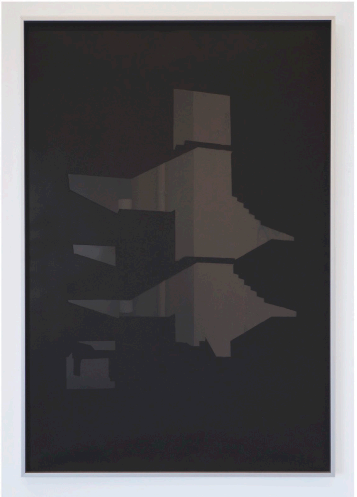
viaFaenza-Barona_01 - Oil painting on black translucent paper + digital print, 79 X 54 cm. (2022) unique piece € 2300,00