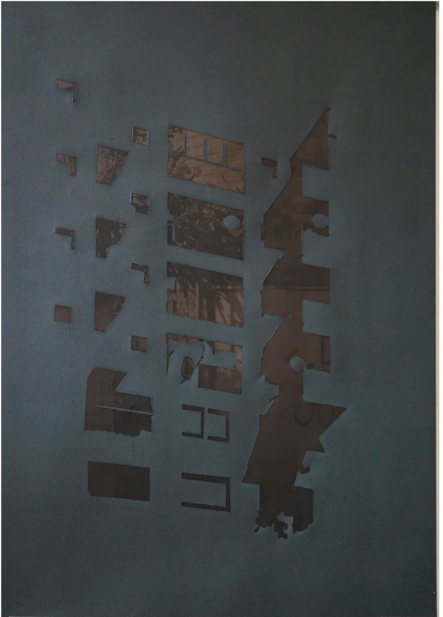
viaCampari-Barona_01 - Oil painting on black translucent paper + digital print, 79 X 54 cm. (2022) unique piece € 2300,00