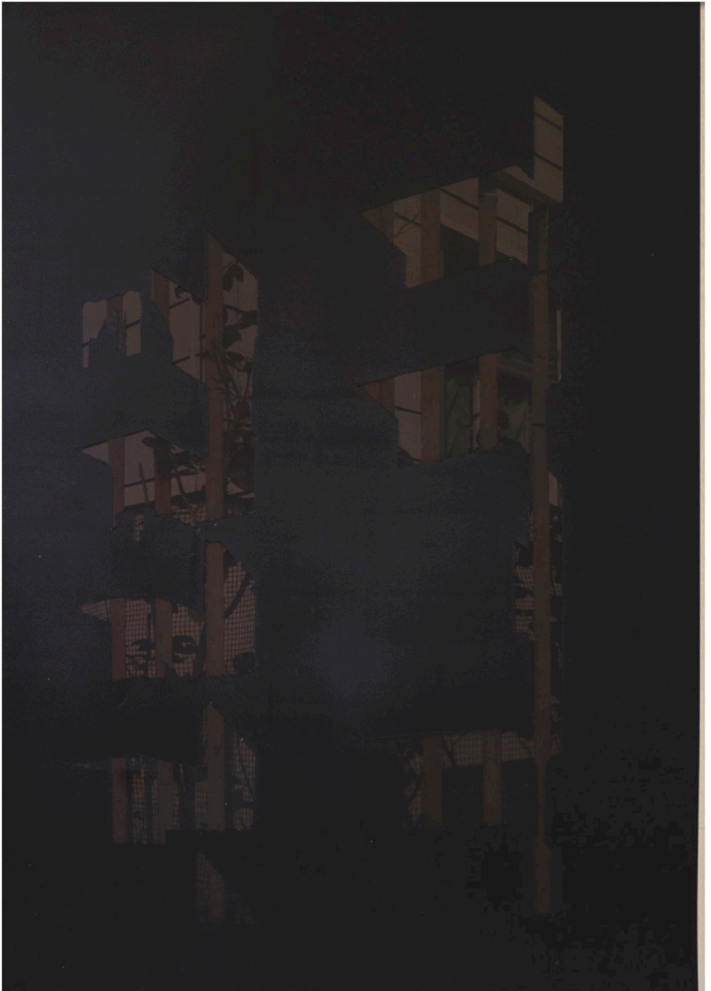
viaRossi-Barona_01 - Oil painting on black translucent paper + digital print, 79 X 54 cm. (2022) unique piece € 2300,00