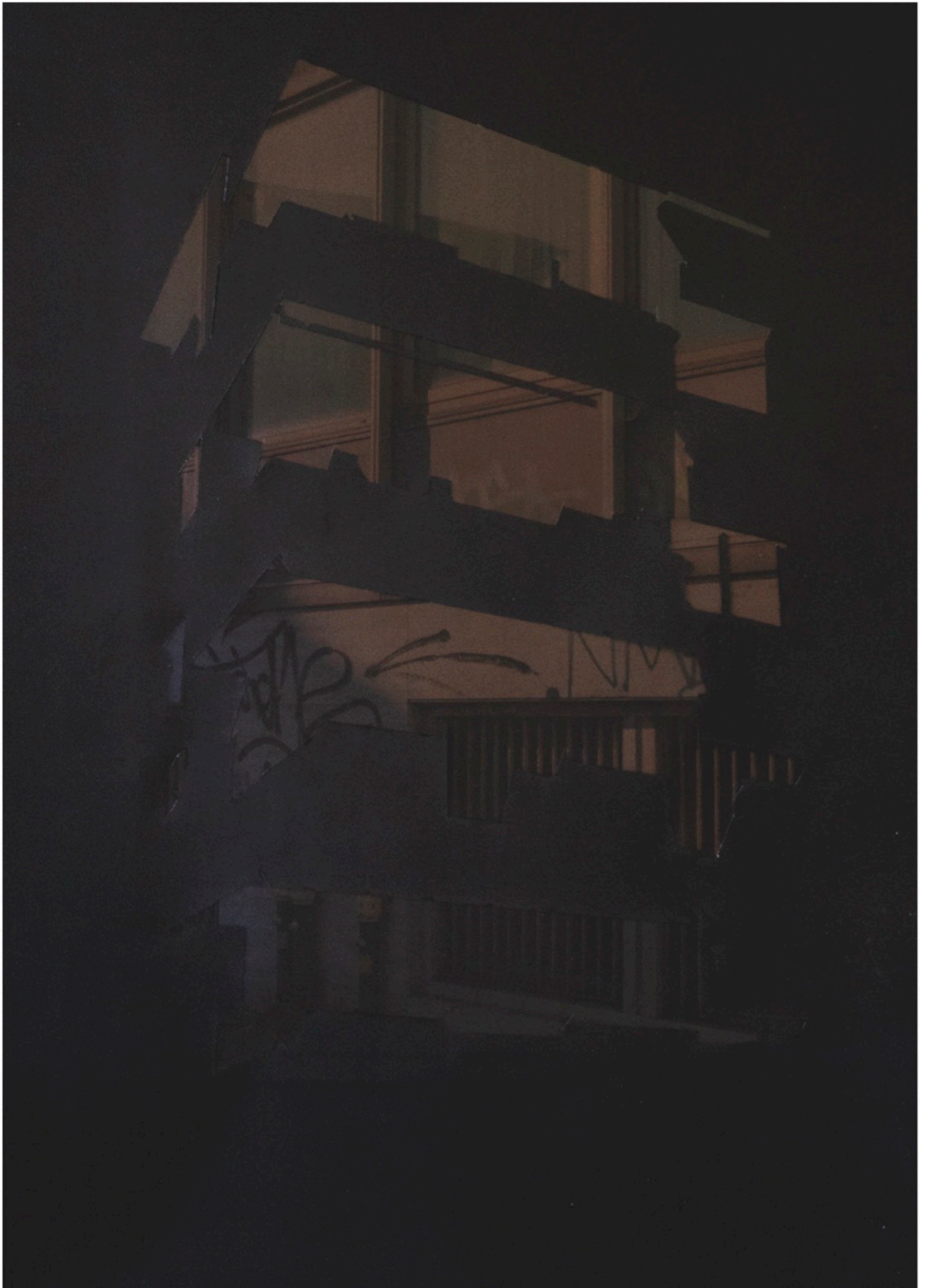
viaGiambellino_06 - Oil painting on black translucent paper + digital print, 79 X 54 cm. (2022) unique piece € 2300,00