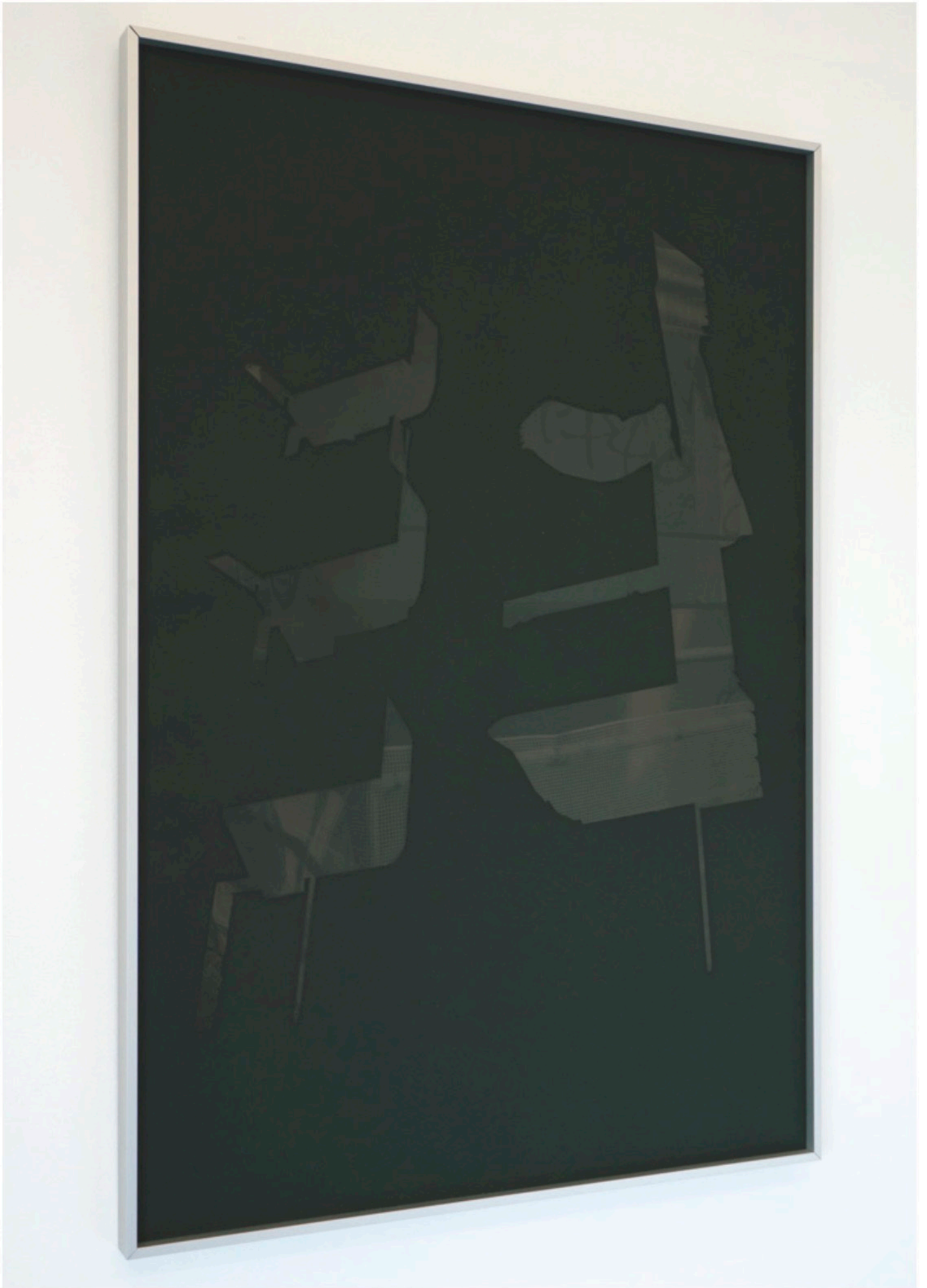
viaGiambellino_02 - Oil painting on black translucent paper + digital print, 79 X 54 cm. (2022) unique piece € 2300,00