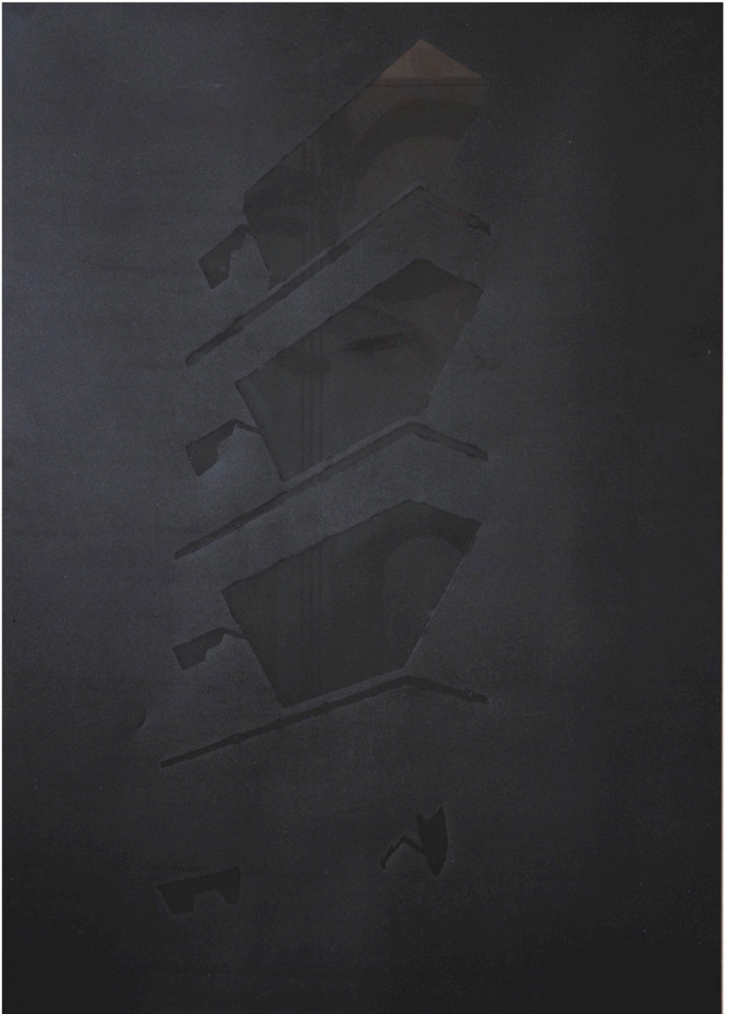
viaGiambellino_03 - Oil painting on black translucent paper + digital print, 79 X 54 cm. (2022) unique piece € 2300,00